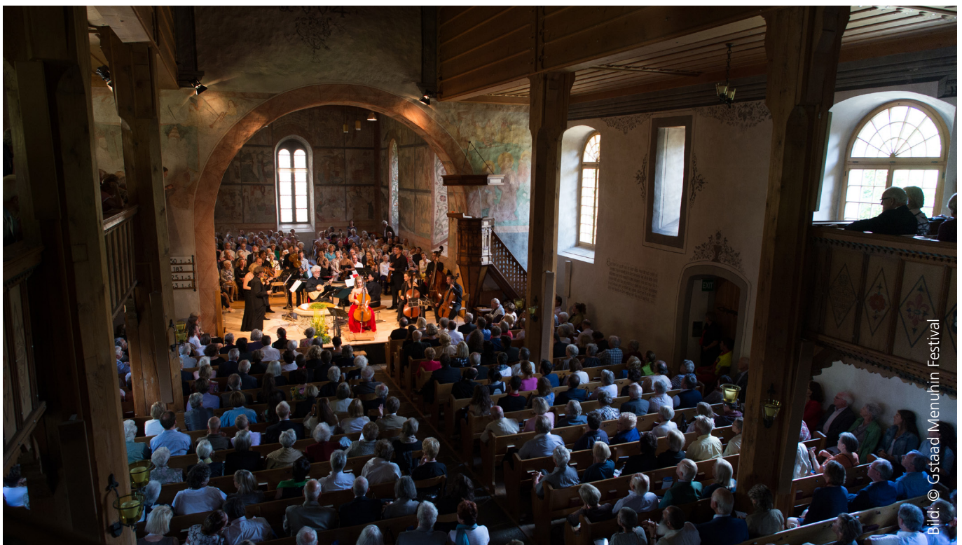
Das Menuhin Festival Gstaad mit seinen Kirchenkonzerten als einer der Grossanlässe in der Gemeinde Saanen

Basierend auf einem Wirkungsmodell und einer empirischen Analyse der regionalwirtschaftlichen Auswirkungen der Grossanlässe wurde der Event Performance Index (EPI) entwickelt. Das Saaner Modell des EPI berücksichtigt die wichtigsten wirtschaftlichen, sozialen sowie ökologischen Bereiche und bewertet die Anlässe anhand von sieben Kriterien. Anhand des resultierenden EPI berechnet das Tool direkt einen monetären Unterstützungsbeitrag. Die Anwendung des Bewertungstools ermöglicht es somit einer Gemeinde oder einer Destination, die finanzielle Unterstützung von Anlässen transparent, systematisch und im Sinne einer nachhaltigen Entwicklung zu gestalten.