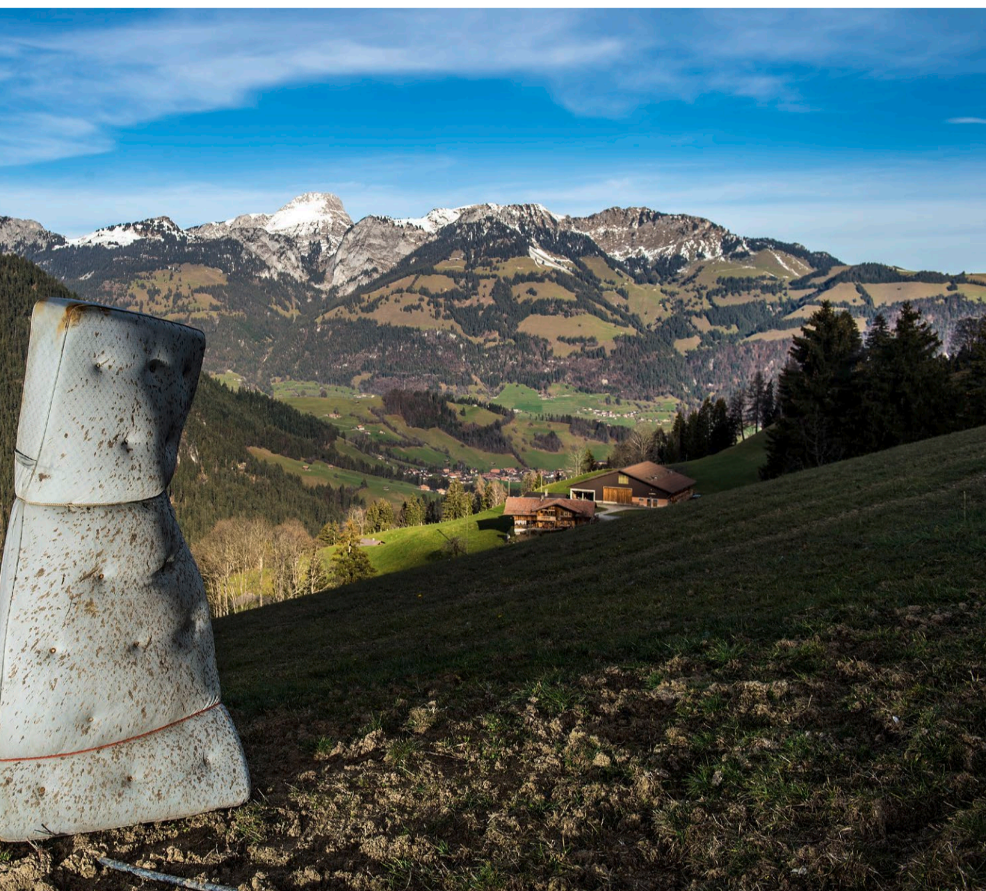
Skulptur auf einer Skipiste im Dientigtal.

der Skisaison. Doch da der Schnee fehlt, sind die meisten Ski-Anlagen im Berner Oberland ausser Betrieb. Die Touristen bei Laune zu halten, haben verschiedene Skiregionen nun Alternativprogramme zusammengestellt.