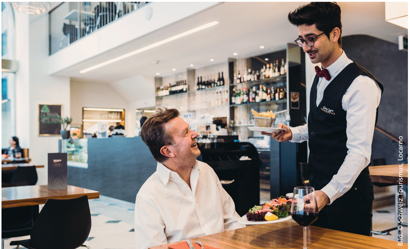
Ein persönlicher und empathischer Service als Begeisterungsfaktor in der Hotellerie kann ein Differenzierungsmerkmal sein und sowohl Gäste als auch Mitarbeitende erfreuen.

Im Kontext fehlender Möglichkeiten zu Preisstrategien, hoher Gästeerwartungen und der steigenden Bedeutung der Erlebnisqualität ist die Gastfreundlichkeit ein zentrales und vieldiskutiertes Thema für den Schweizer Tourismus. Mit der Einführung des PRIX BIENVENU als Preis für die Musterschüler der gastfreundlichen Hotellerie hat Schweiz Tourismus im Jahr 2013 eine Datenbasis geschaffen, die es ermöglicht, das Phänomen und seine Bestimmungsfaktoren sowie Effekte näher zu beleuchten. Die Forschungsstelle Tourismus (CRED-T) der Universität Bern hat mit den Praxispartnern Gastro-Suisse, hotellerieuisse, Schweiz Tourismus sowie dem Verband Schweizer Tourismusmanager (VSTM) umfassend untersucht, welche Faktoren auf Betriebs- und Destinationsebene in Zusammenhang mit einer hohen von Gästen wahrgenommenen Gastfreundlichkeit stehen. Gemessen wurde anhand der PRIX BIENVENU Scores aus aggregierten Online-Bewertungen. Neben den quantitativen Analysen zeigen Best Practice Beispiele, worauf es beim Thema Gastfreundlichkeit ankommt und wo Ansatzpunkte zu dessen Stärkung liegen könnten.