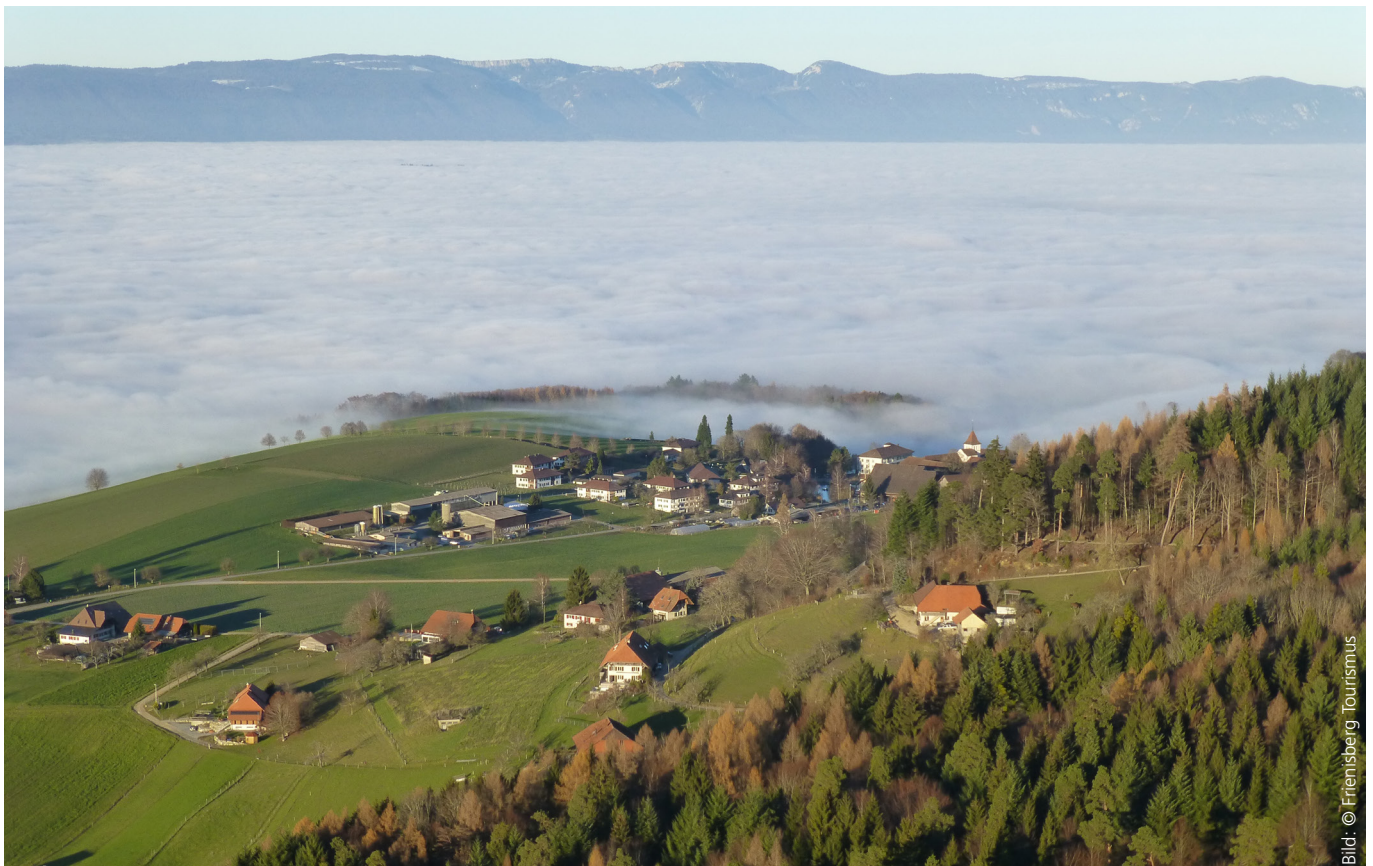
Region Frienisberg Tourismus

In einer Analyse überprüfte die Forschungsstelle Tourismus (CRED-T) im Auftrag der Regionalkonferenz Bern-Mittelland (RKBM) das Potenzial einer neuen eigenständigen Tourismusregion „Umgebung Bern“. Räumlich handelt es sich bei dem Gebiet um den Perimeter der Regionalkonferenz Bern-Mittelland (RKBM). Viele Gemeinden in diesem Perimeter sind keiner touristischen Subregion (bspw. Emmental, Ob- und Nidwadt, Laupen) angeschlossen. Um einen Gast direkt in die „Umgebung Bern“ zu locken, sollte das touristische Angebot über ein hohes Attraktionspotenzial verfügen. Dies bedeutet, dass es in ein Gesamtangebot eingebettet ist, in dem das ursprüngliche Angebot mitberücksichtigt wird, aber auch das abgeleitete Angebot (touristische Infra- und Suprastruktur, Attraktionen und Events) vorhanden ist. Es sollte insgesamt eine hohe Erlebnisdichte an solchen Angebots-elementen vorhanden sein und es bedingt eine zusammenhängende und vollständige Dienstleistungskette. Das Potenzial des vorhandenen Angebots galt es zu prüfen und Handlungsempfehlungen abzuleiten. Dazu wurde das bestehende Angebot eruiert, bewertet und mit ähnlichen Tourismusregionen verglichen.