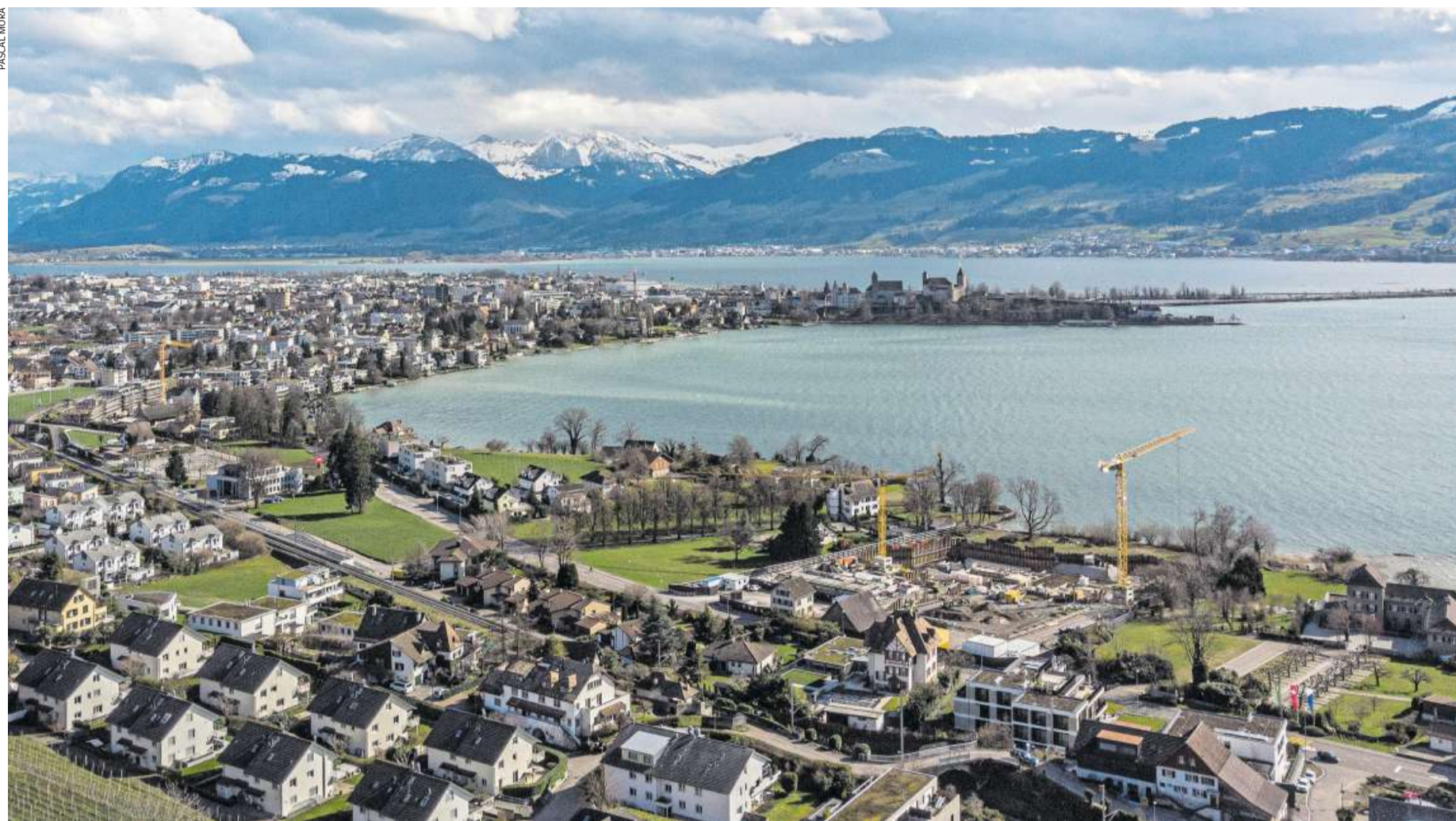
Trotz höheren Steuern ein Magnet für Reiche: Tennisstar Roger Federer bezieht demnächst sein neues Heim an bevorzugter Lage in Rapperswil. (12. März 2021)

Was hat zu diesem Umschwung geführt? Zum einen gerieten manche Kantone und Gemeinden durch ihre aggressive Steuerpolitik in eine finanzielle Schieflage.