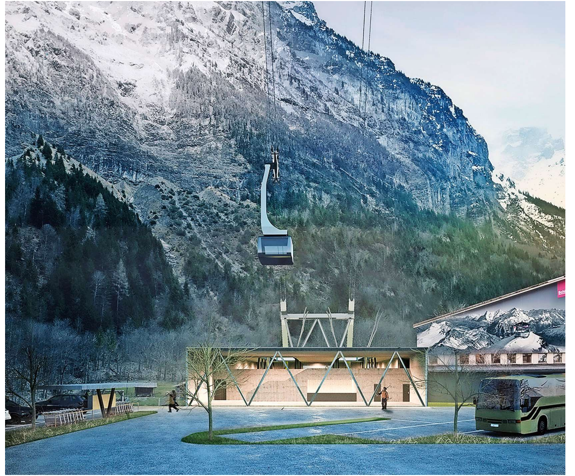
Von Stechelberg soll eine neue Luftseilbahn direkt nach Mürren führen.

Weitere Wintersportanlagen seien ebenfalls nicht vorgesehen. Die bestehenden Pisten und Anlagen könnten eine Kapazitätserweiterung der Bahn gut aufnehmen, sie seien nicht überlastet, nur bei der Luftseilbahn selbst gebe es derzeit gelegentlich Wartezeiten. Auch Rodewald sagt, das Gebiet sei nur beschränkt ausbaubar. Kommt eine Erschliessung des unberührten Saustals infrage? Egger verneint klar. Das sei auch gar nicht möglich, denn dieses Gebiet liege in einer Schutzzone. Und Rodewald hält fest, dass sich die Stiftung gegen eine solche Erweiterung mit Händen und Füssen wehren würde.