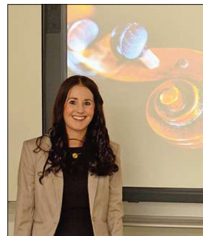
Nina Defuns ei sededicada alla canzun giudaica cantada el temps dalla persecuziun dils nazis.

dad oz e quella d'antruras. Ils fegls e las feglias da purs ein da lur temps da giuventetgna stai integrai ella lavur purila dalla famiglia. Las forzas giuvnas eran da nez per ils geniturs e lur sustegn in'obligaziun per ils giuvens e las giuvnas. Ella veta ei lu mintgin ius sia via individuala sco quei ch'igl ei era oz il cass. La veta era da glieg temps pli restrenscheda e cunzun las dunnas havevan buca las schanzas da sesviluppar. Lur via era per gronda part destinada dalla tradiziun sociala. Sco dunna da casa, mamma e survienta dalla famiglia era sia rolla definada e vegneva suandada. La