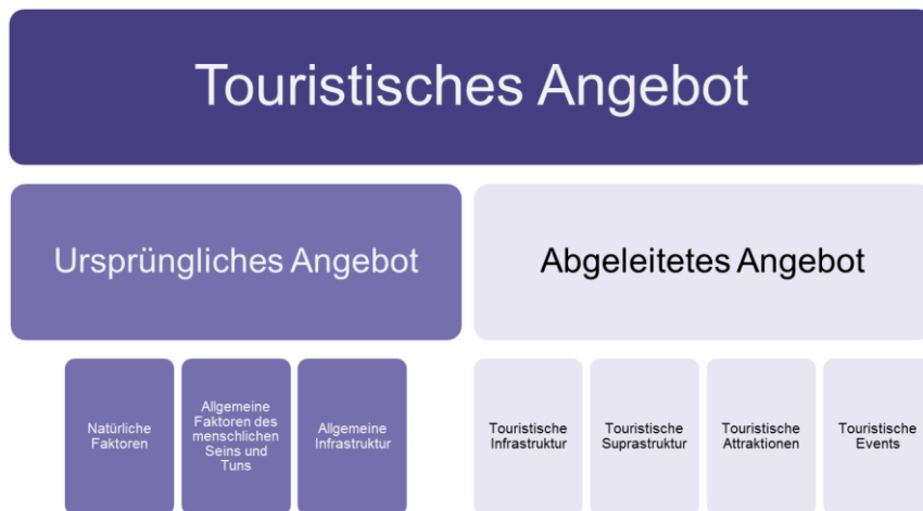
Abbildung 2: Elemente des touristischen Angebotes